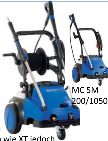
MC 5M 200/1050

MC 5M 200/1050; Daten wie XT jedoch ohne Trommel, nur mit 10m.HD-Schlauch, ohne Turbohammer,